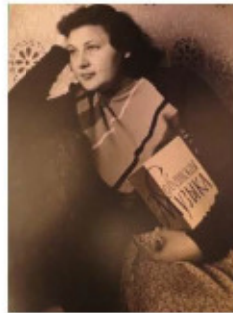
1920 – 1993

Artıq o illərdə Konservatoriyada Mayor Brenner – Kövkəb Səfəraliyeva duetində yeni yaranmış fortepiano ansamblı janrı onun diqqətini cəlb etmişdi. Bu janrdə o, həm klassik və digər bəstəkarların əsərlərini ifa edir, həm də opera və orkestr əsərlərinin öz fərdi transkripsiyaları ilə orkestr, opera və musiqinin iri həcmli formalarına olan məhəbbətini əks etdirə bilmişdir. Bəstəkarlıq təhsili ona klavirləri deyil, orkestr partituralarını əsas götürərək bu işi ustalıqla həyata keçirməyə imkan verirdi. Üzeyir Hacıbəylinin “Koroğlu” operasına Uvertüranın transkripsiyası çoxillik tanınmış duet Yevgeniya Perevertaylo – İvettə Plyamın repertuarında dəyərli yer tutmuşdur və bəstəkar tərəfindən də yüksək qiymətləndirilmişdir.